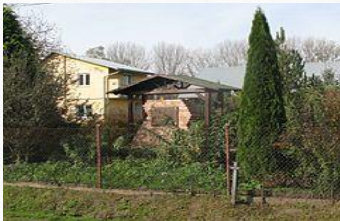
Tablica w miejscu domu urodzenia Ignacego Łukasiewicza