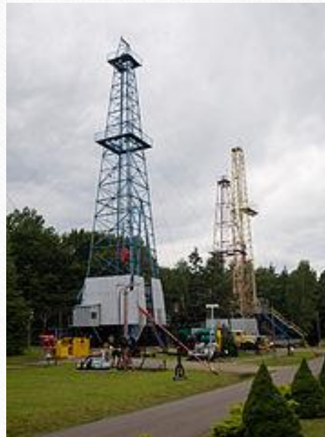
Kopalnia ropy naftowej w Bóbrce, obecnie Muzeum Przemysłu Naftowego i Gazowniczego im. Ignacego Łukasiewicza – otwarta w 1854 roku i nadal działająca, kopalnia ropy naftowej w Bóbrce