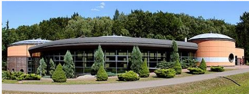
Muzeum Nafty i Gazu