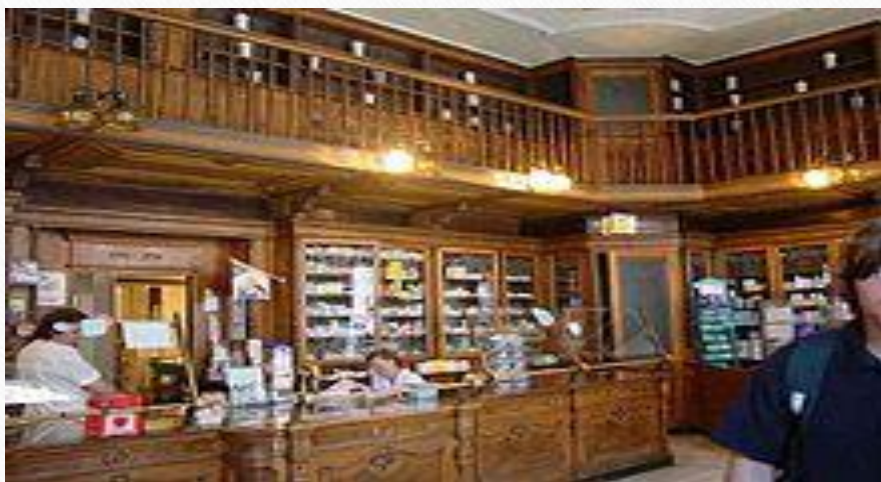
Wnętrze dawnej apteki Mikolascha we Lwowie w 2002 r.