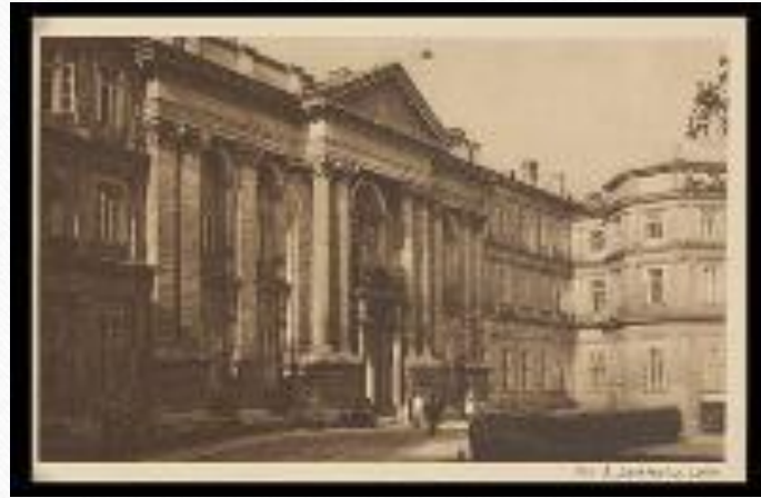
Szpital powszechny we Lwowie zdj z 1937 roku

Łukasiewicz starał się potem znaleźć dla nafty zastosowanie praktyczne. Stosowane do tej pory lampy oliwne nie nadawały się do nafty i wymagały przekonstruowania. Pierwsza skonstruowana przez Łukasiewicza lampa rozświetliła wystawę apteki. 31 lipca 1853 roku jest symboliczną, oficjalną datą narodzin przemysłu naftowego w Polsce. Po raz pierwszy zastosowano w praktyce oświetlenie naftowe podczas pilnej nocnej operacji w szpitalu powszechnym na lwowskim Łyczakowie