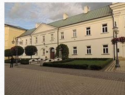
I Liceum Ogólnokształcące w Rzeszowie (popijarowskie gimnazjum)