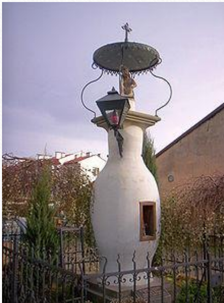
Miejsce zapalenia pierwszej na świecie ulicznej lampy naftowej w Gorlicach